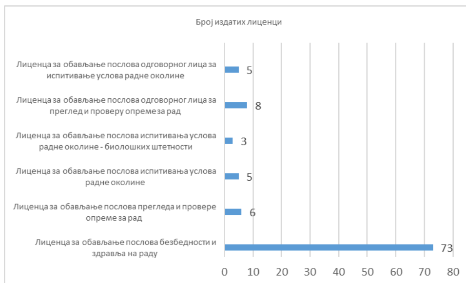
Дијаграм 2. Број издатих лиценци

У Табели 21 и на Дијаграму 3 приказан је број обновљених лиценци у 2021. години.